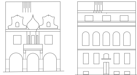
FAS. PŘEDNÍ /SEVER/