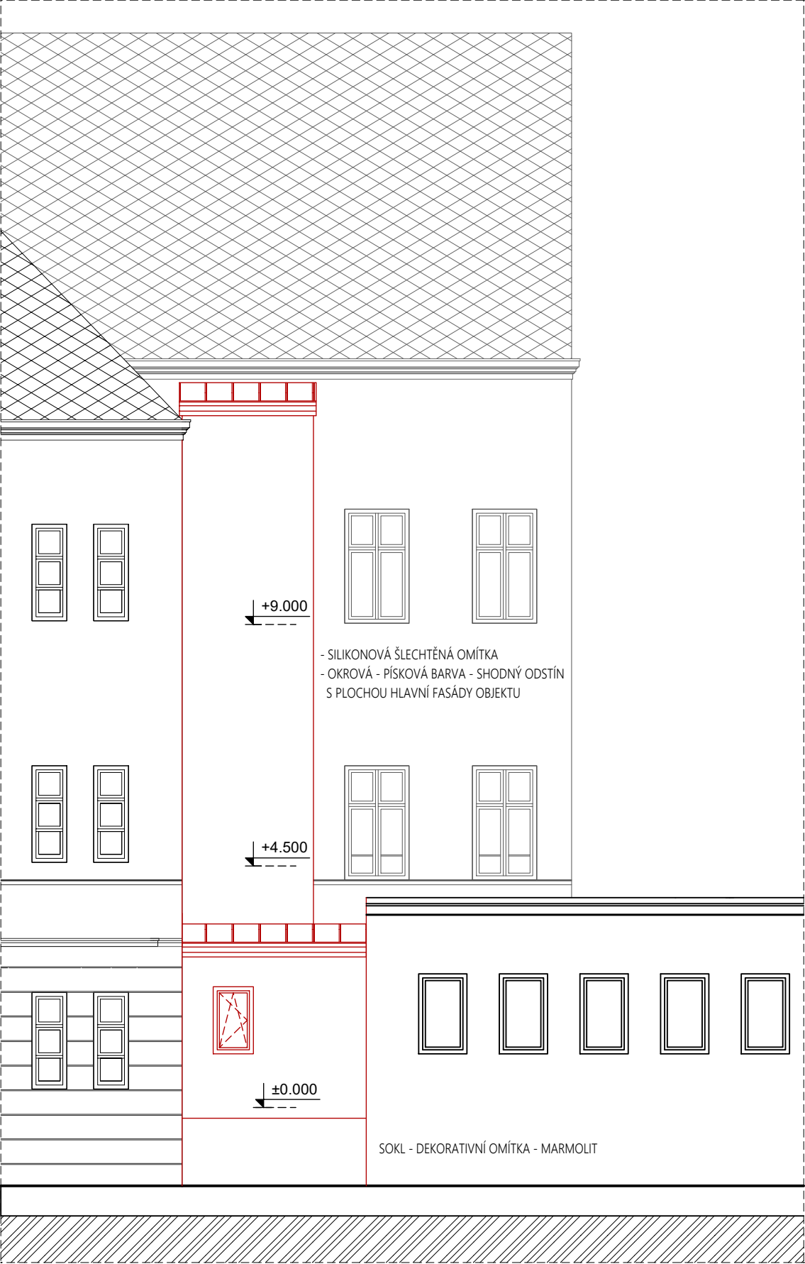
JIŽNÍ POHLED ZE DVORA NA VÝTAHOVOU ŠACHTU V1