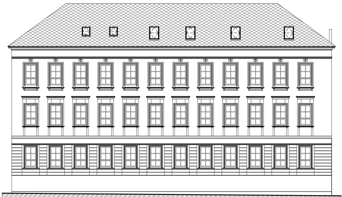
ZÁPADNÍ POHLED - ULICE