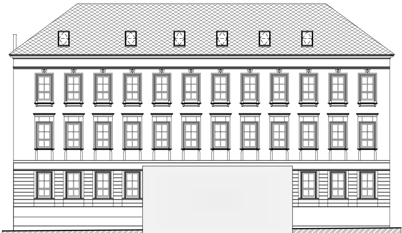
VÝCHODNÍ POHLED - ULICE