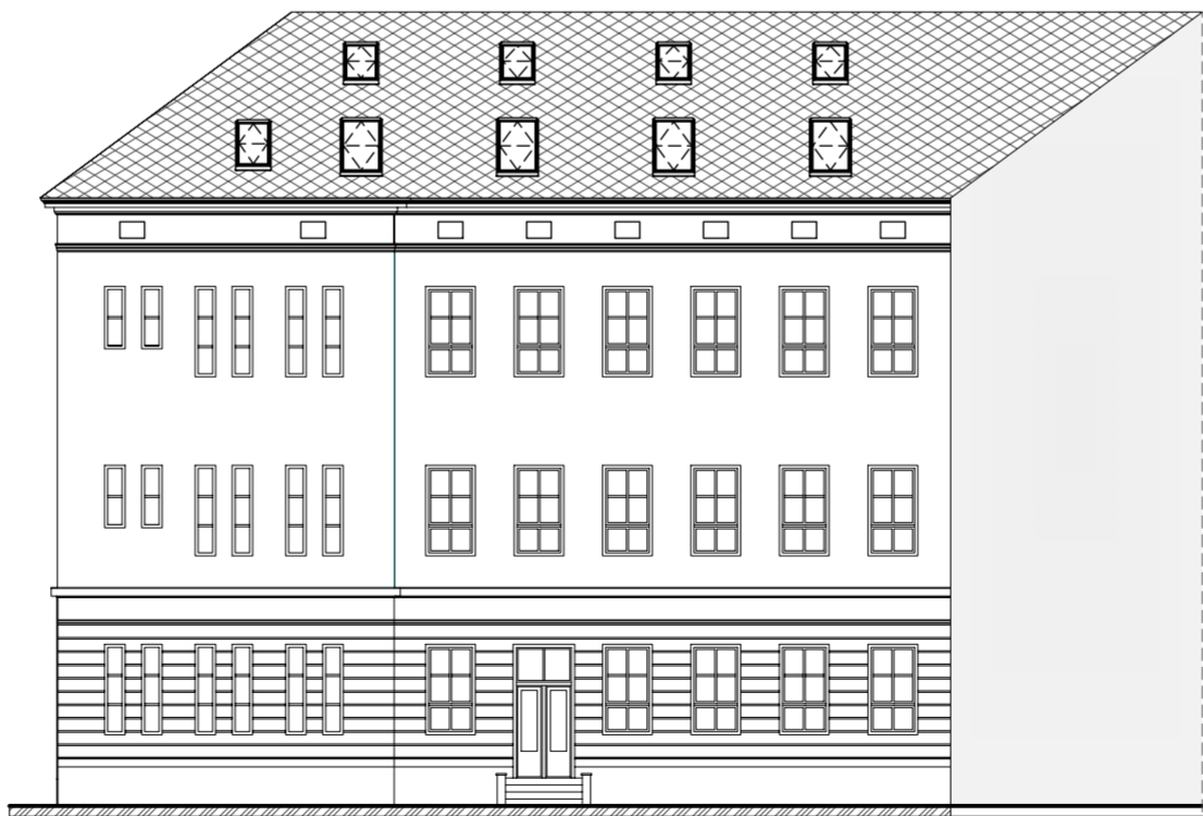
ZÁPADNÍ POHLED - DVŮR