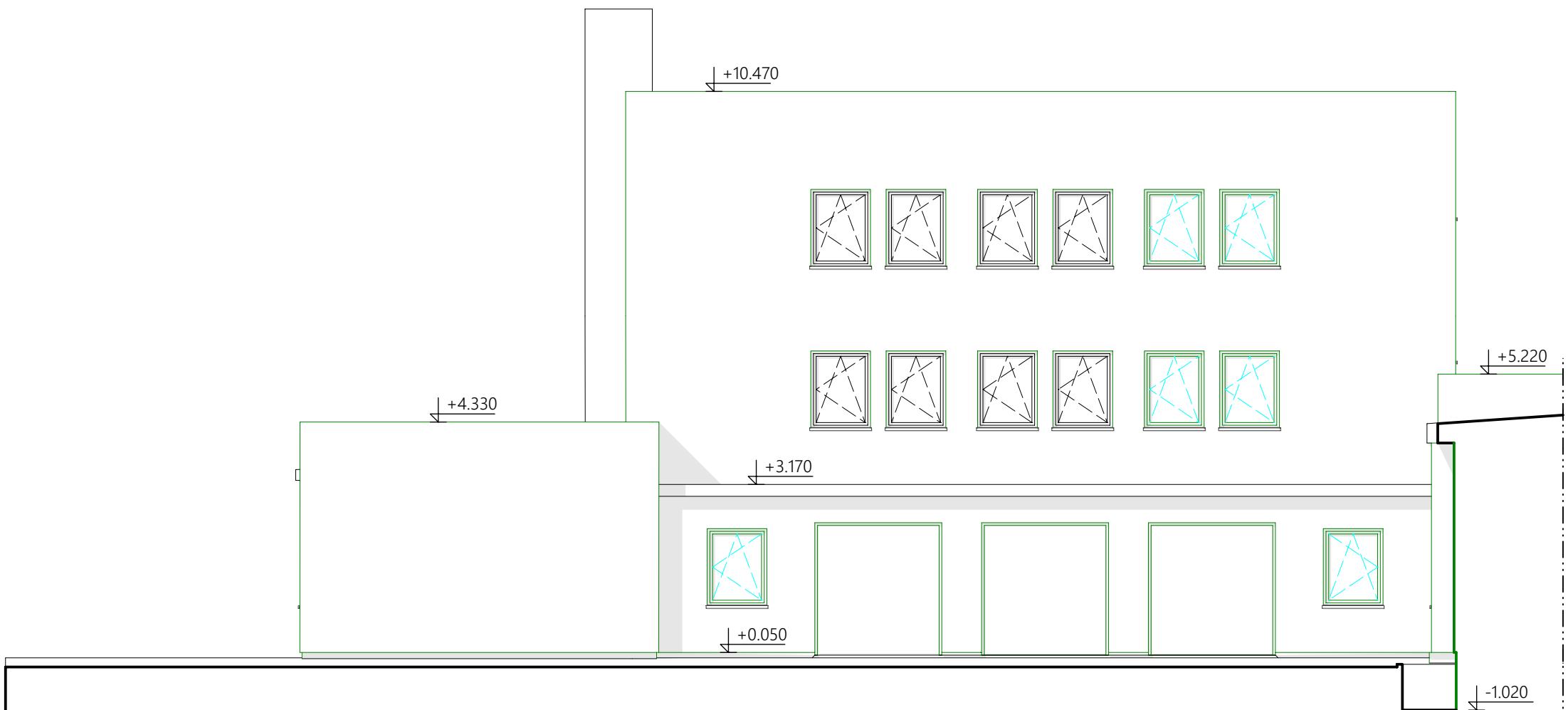
POHLED JIŽNÍ 2